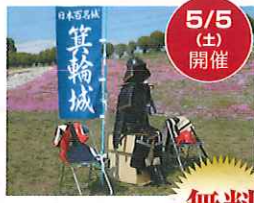
みのわの里のきつねの嫁入り出前行列