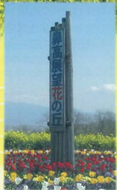
菜の花エコプロジェクト実践地