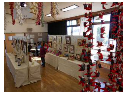
昨年度・作品展の様子

当プラザ主催の各種教室で制作した作品や、市民の皆さまの手芸品など、ご応募いただいた素敵な作品を2日間展示します。ぜひご来場ください。