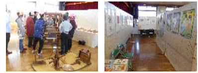
昨年度・人権展の様子