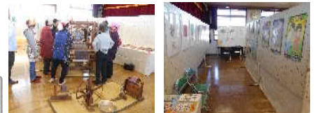
昨年度・人権展の様子

一人ひとりがあらゆる人権問題に対する正しい認識と理解を深めていただけるよう、関連事業とあわせて人権展を開催します。多くの皆さまのお越しを心からお待ちしております。