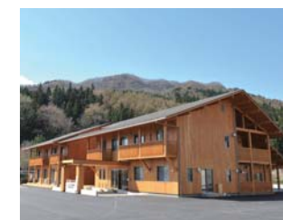
英語で山村留学を行う「くらぶち英語村」を整備(総務費)