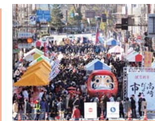
「高崎だるま市」開催費用の補助(商工費)