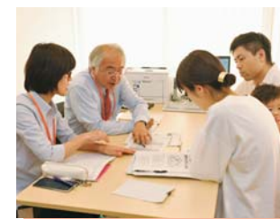
子育て支援の拠点「子育てなんでもセンター」を開設(民生費)