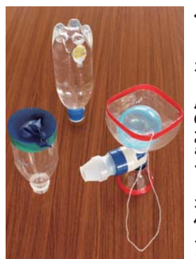
身近なものがおもちゃに変身

身近なものがおもちゃに変身 ●期日 7月7日(土) ●会場 創作室 ●内容 ペットボトルを使って、けん玉などを作る ●対象 5歳〜小学生(小学3年生以下は保護者同伴) ●定員 20人 ●費用 300円 ●プログラムで遊ぼう ●期日 7月8日(日) ●会場 パソ