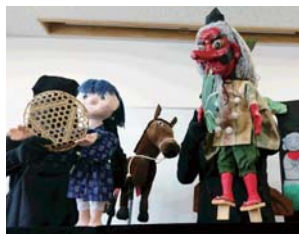
「てんぐのかくれみの」の一場面