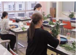
見本を見ながら生ける

いずれも時間は、午後6時30分～8時30分(華道は午後5時から)で、対象は市内に在住か在勤の45歳以下の勤労者(アロマピラティスは女性だけ)です。