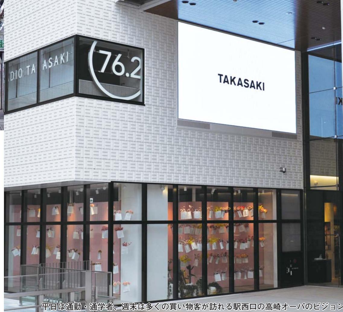
平日は通勤・通学者、週末は多くの買い物客が訪れる駅西口の高崎オーパのビジョン