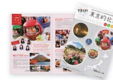
台湾向け観光パンフレット「TRIP! 東京的北側」