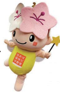
宇都宮市マスコットキャラクター・ミヤリー