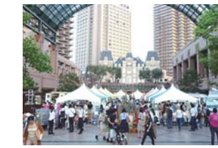
首都圏での4市連携物産フェア「きたかんマルシェ」