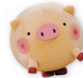
前橋市マスコットキャラクター・ころとん