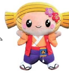
水戸市マスコットキャラクター・みとちゃん