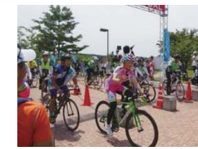
4市を自転車で巡る長距離サイクリング「北関東 400kmブルベ」

北 関東3県の中核都市となつてい る高崎市、前橋市、宇都宮市、 水戸市。いずれも東京から100km 圏に位置しています。4市は、平 成26年4月に「北関東中核都市連携 会議」を設置しました。互いに連携し、 交流を深めながら、北関東全体の魅 力を高めて発信していくことが目的 です。これまでに、都内での物産展 の開催や台湾向け観光パンフレット の作成など、さまざまな取り組みを 実施してきました。 北関東自動車道の利用で、本市と 短時間で結ばれるようになった3市。 それぞれに魅力あふれる各市の見ど ころやグルメなどを紹介します。 問い合わせは、企画調整課 ☎321- 1202へ。