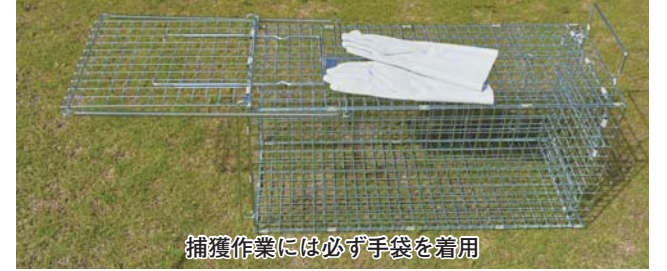
捕獲作業には必ず手袋を着用

●費用 = 無料 (捕獲用の餌代は申請者負担) ●その他 = 箱わなの設置は申請者が行ってください。捕獲した鳥獣は、市職員が訪問して回収します