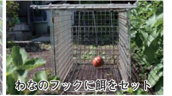
わなのフックに餌をセット