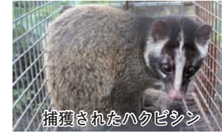
捕獲されたハクビシン