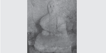
③小暮の穴薬師部分(高崎市吉井町小暮) (穴薬師横穴墓、石像は鎌倉期と推定)