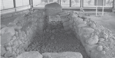
②山名原口Ⅱ号古墳(高崎市山名町)