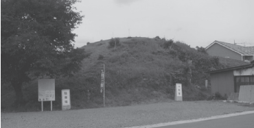
①漆山古墳(高崎市下佐野町)