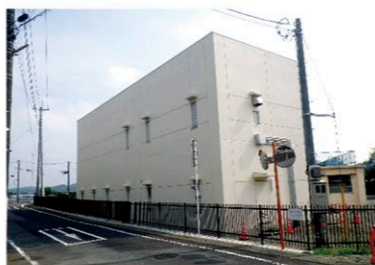
汚水中継ポンプ場(下和田中継ポンプ場)