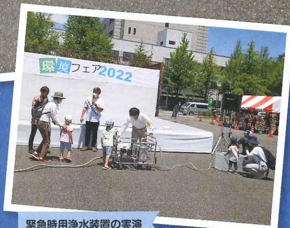
緊急時浄水装置の実演