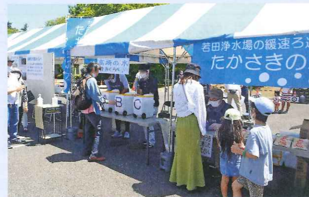
「高崎の水」飲み比べ

本市では、関連事業として、市環境部で実施している「環境フェア」との共催により、6月4日(土)にもてなし広場で、イベントを実施しました。上下水道局エリアでは、例年実施している花苗の配布や「高崎の水」飲み比べ、水道管で作る水鉄砲作り・水鉄砲大会を実施し、家族連れなど多くの来場者で賑わいました。