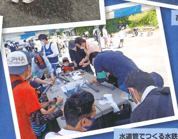
水道管でつくる水鉄砲