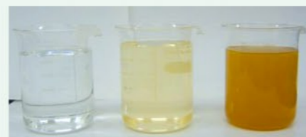
左から通常の状態、赤水の薄いもの、赤水

A 回答 宅内の水道管に使用年数が長い銅管がある場合、管の内部にさびが発生している可能性があります。夜間など長時間水道を使わないと、水道管の中にたまった水がさびを取り込んでしまい、朝の使い始めなどに赤い水が出る場合があります。対策としては、使い始めの水は飲用にせず、バケツ1杯程度の量を放流すると水が透明になります。放流した水はお庭の散水等にお使いください。