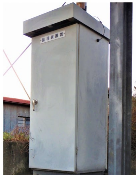
ポンプ場に設置されている遠隔監視装置