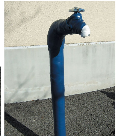
保温材をビニールテープで巻いた状態