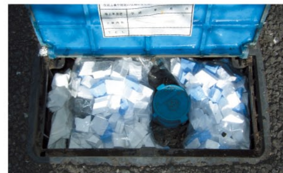
発泡スチロールを入れたビニール袋をメーターボックス内に詰めた状態