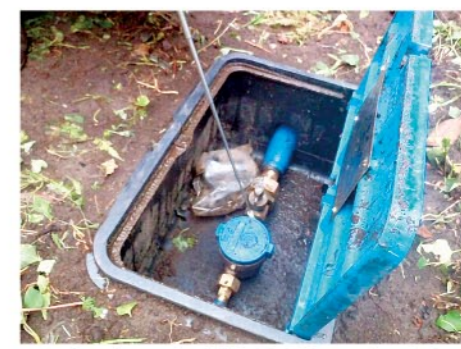
※漏水調査は、音聴棒などを使って行います。

水道メーターより家側の漏水調査は行っておりません。家側で漏水がある場合は、個人負担となります。指定給水装置工事業者に依頼して修繕してください。水道メーターより道路側の宅地内および道路上での漏水を発見した場合は、水道局工務課までご連絡ください。