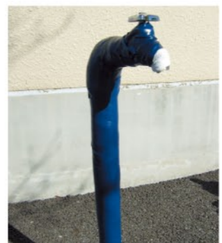
保温材をビニールテープで巻いた状態