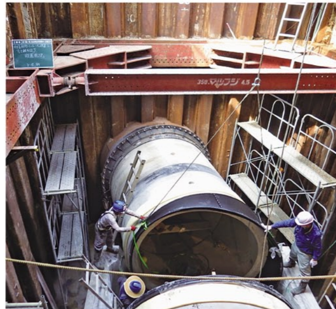
工事の様子 (下之城町)

水洗化率 94.80% (水洗化人口260,401人) ※水洗化率：下水道を利用できる区域の人口のうち、実際に下水道に接続している人口の割合