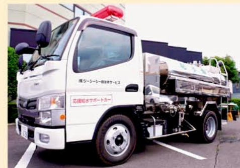
(株)ジーシー自治体サービスの給水車

この締結により、有事の際の給水車による支援活動はもちろんのこと、防災訓練への参加などでも連携を図っていきます。