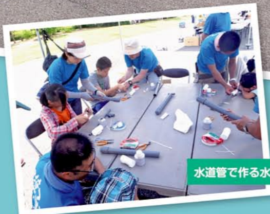
水道管で作る水鉄砲