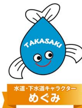
水道・下水道キャラクター めぐみ