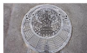
特徴的な二重のマンホール蓋

そのため、公道上にマンホール形式のポンプ場を設置して、汚水を汲み上げて、再び浅い位置から自然流下で流す工夫をしています。