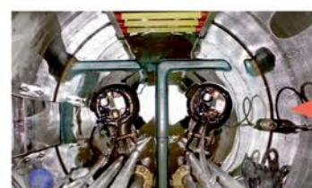
ポンプ2台が設置された槽内

油や水に溶けない紙、布、土砂等を流すとポンプが故障して、宅内から汚水があふれます！