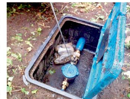
※漏水調査は、音聴棒などを使って行います。

※水道メーターより家側の漏水は個人での対応となります。市指定工事店へ修繕をご依頼ください。