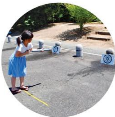
水道管で作る水鉄砲