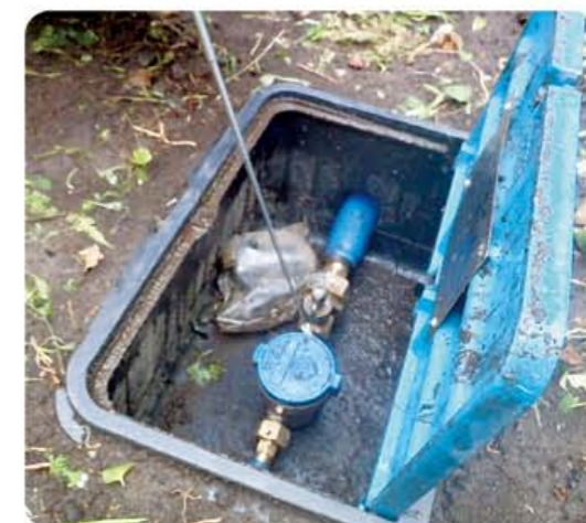
※漏水音の抽出は、音聴棒を使って行います。

道路上で漏水を発見した場合は、水道局工務課までご連絡ください。よろしくお願いいたします。