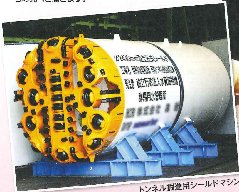
トンネル掘進用シールドマシン