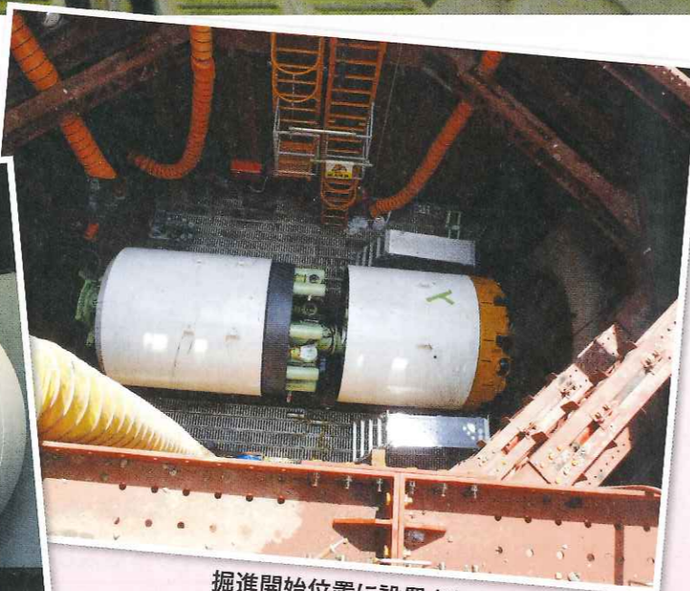
掘進開始位置に設置されたシールドマシン