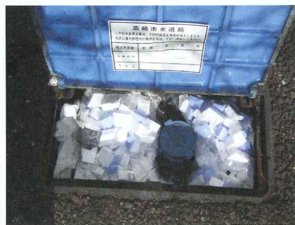
発泡スチロールを入れたビニール袋をメーターボックス内に詰めた状態

冬になると、屋外の水道管やメーターボックス内で凍結事故が多発します。ご家庭にあるタオルとビニールテープ・市販の保温材を巻き付けるなどして、凍結を防止してください。