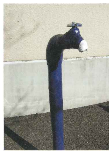
保温材をビニールテープで巻いた状態