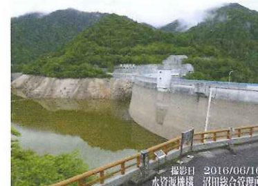
取水制限開始時の矢木沢ダム(2016年6月16日)