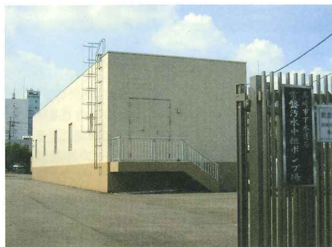
常盤汚水中継ポンプ場

私たちは、市民の皆さんが安心して快適に生活できる環境を提供できるよう、当ポンプ場を含め下水処理に係る施設等の安定稼働に日々努めております。