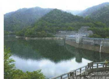
前年同時期の矢木沢ダム(2015年6月1日)