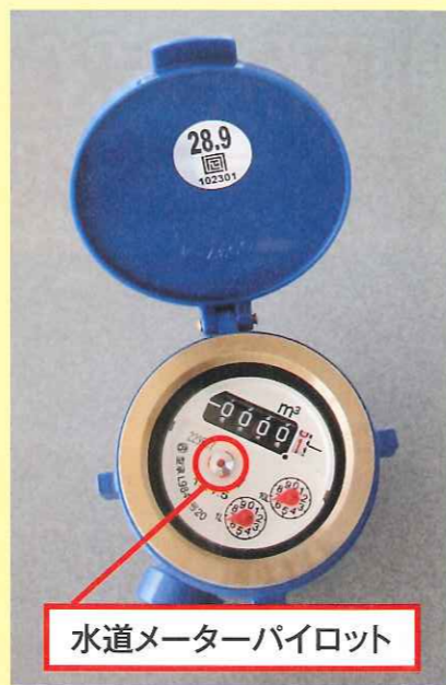
水道メーターパイロット