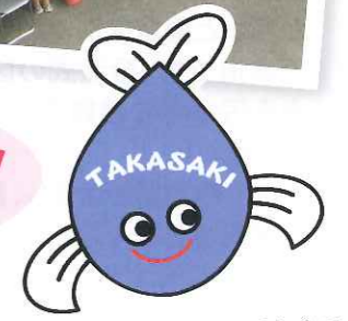
水道・下水道キャラクター めぐみ