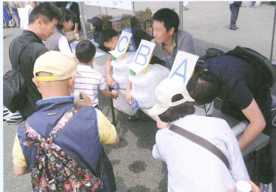
「高崎のみず」のみくらべ

水道週間は、水道について皆様の理解と関心を高めていただき、公衆衛生の向上と生活環境の改善を図るための週間です。1959年(昭和34年)に厚生省(当時)により制定されました。毎年6月1日～6月7日。