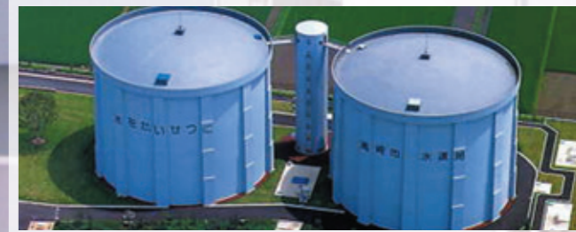
この配水場は、群馬県企業局県央第一水道からの飲料水を安定的に供給するとともに、災害時緊急時のための備蓄用水を確保する役割もあります。2基合わせた総貯水量52,000トンは関東最大規模のものです。