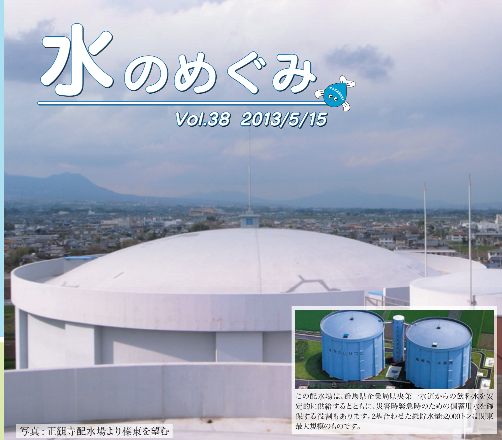
写真: 正観寺配水場より榛東を望む