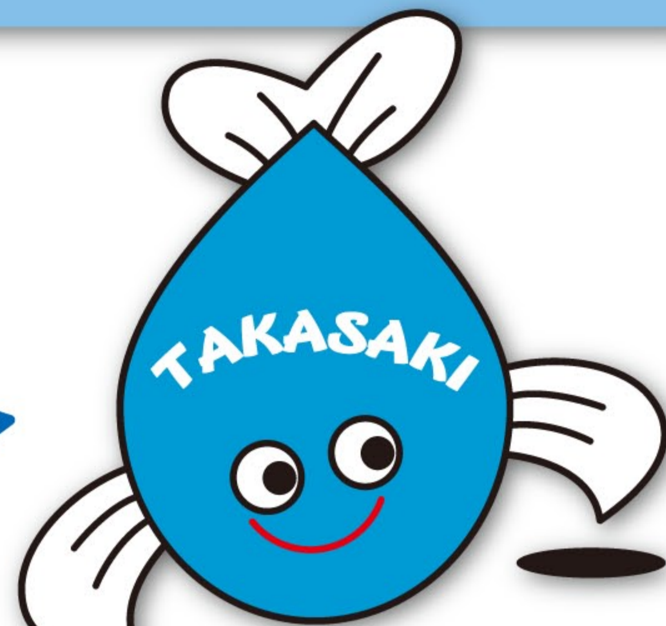
水道・下水道キャラクターめぐみ