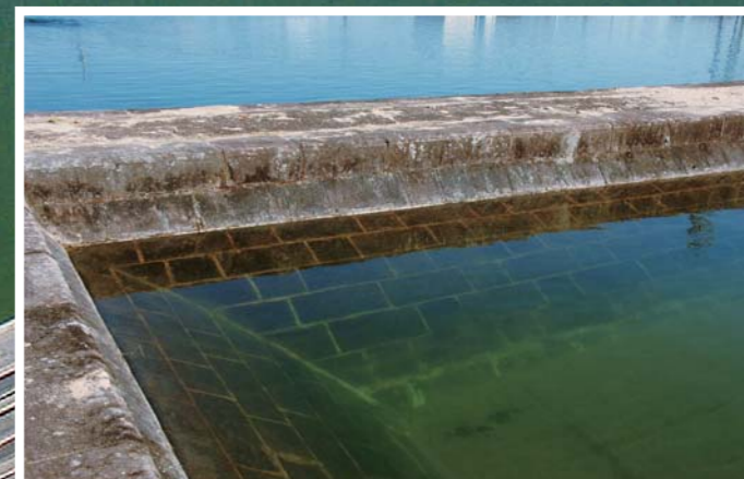
施設の随所に建設当初の面影が残る。

編集・発行 高崎市水道局・下水道局 高崎市高松町35番地1 電話 027-321-1282