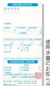
使用水量のお知らせ

料金のお支払いは毎月ではなく2か月ごとになります。使用水量や料金口座振替日は、メーター検針の際にお渡しする「使用水量のお知らせ」で確認できます。