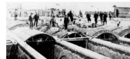
明治43年 建設当時の様子

中に住む微生物の作用で有害な菌類を取り除く<生物ろ過>を組み合わせた浄水方式のことです。