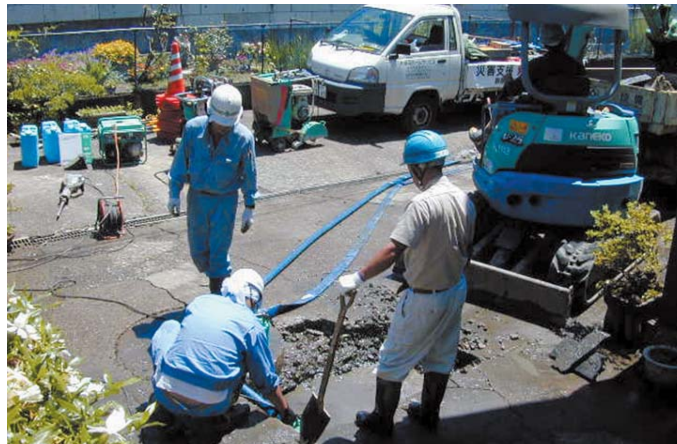
新潟県中越沖地震で被災した柏崎市で水道管復旧に当たる高崎市の応急復旧隊(7月24日)