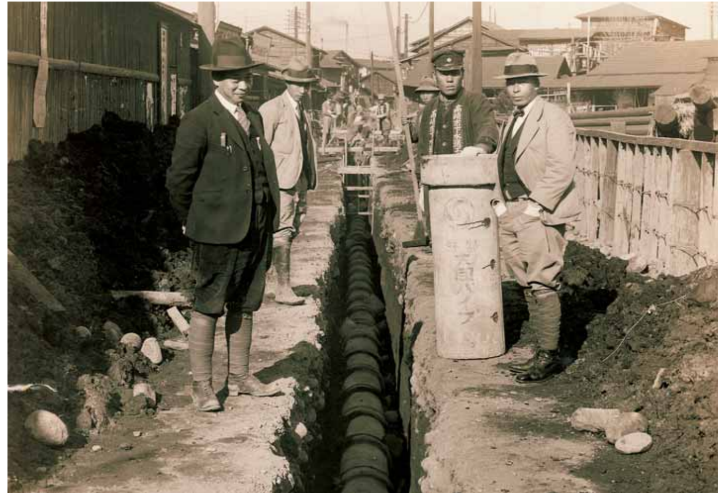
昭和16年（1941年）頃の下水道工事の様子。コンクリート製の300ミリ管を布設しているところ。昭和2年（1927年）に始まった本市の公共下水道事業は、太平洋戦争の激化により中断され、再開されたのは戦後になってからです。写真の撮影地は高崎の旧市街地と思われます。場所をご存知の人は、ご一報ください。