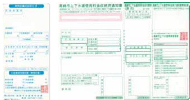
使用水量のお知らせ