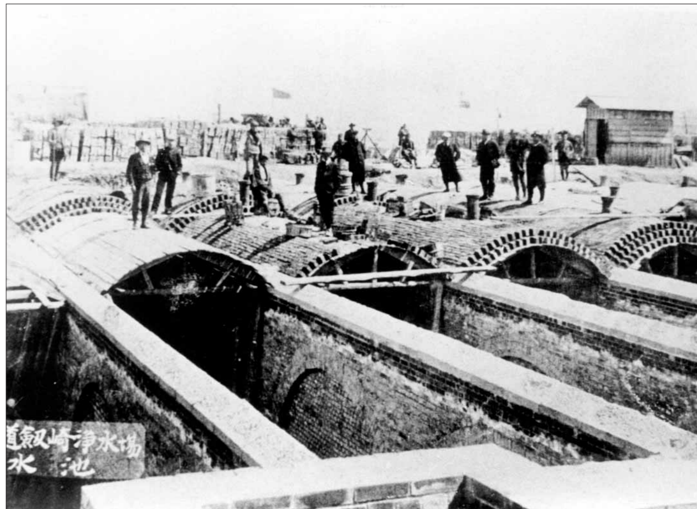
レンガをアーチ型に積み上げた剣崎浄水場配水池は、明治43年(1910年)の完成から昭和56年(1981年)まで71年間使用しました。