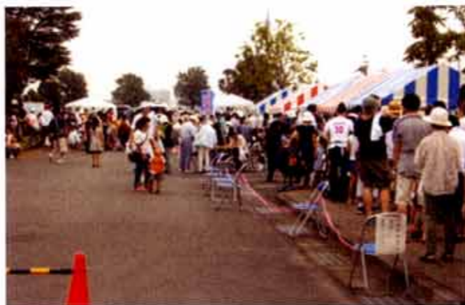
昨年の「下水道の日」イベント