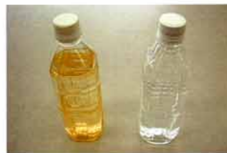
水道の蛇口から出た赤い水(左)と普通の水(右)

回答 宅内の水道管の使用年数が長い銅管の場合、管の内部にさびが発生している可能性があります。夜間など長時間水道を使わないと、水道管の中に水がたまりやすくなります。内部にさびが生じている管では水がさびを取り込んでしまい、朝の使い始めなどに赤い水が出るというわけです。対策としては朝一番の水は飲用にせず、バケツ1杯程度の量を放流すると水が透明になります。放流した水はお庭の散水等にお使いください。また水道工事で水の