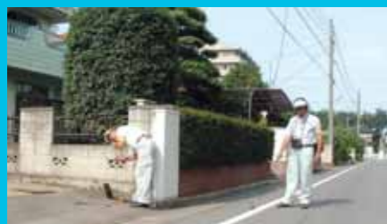
宅地内メーター・付近漏水調査

宅地内の水道メーターより家側の漏水は、個人負担になりますので、高崎市指定工事店に修繕を依頼してください。宅地内の水道メーターより道路側の漏水は、水道局が修繕しますので発見されましたら、給水課に連絡してください。なお、漏水を発見しても調査員が修繕や物品などの販売を行うことは一切ありません。