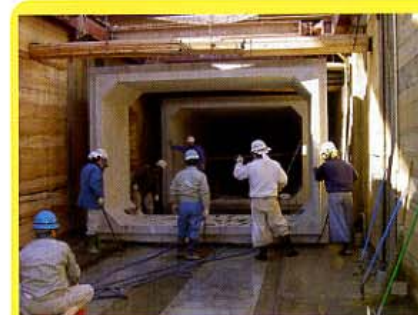
巨大なボックスカルポートを埋設する雨水幹線築造工事