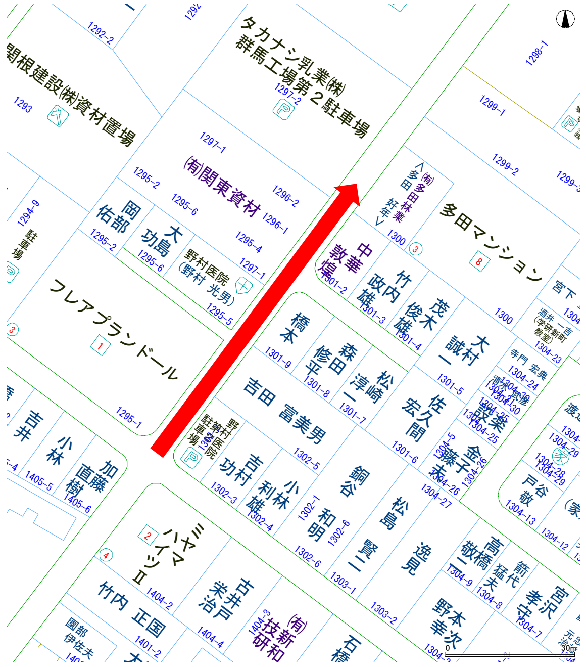
No. 1 神流川雨水 1 - 2 号幹線築造工事(第 5 工区)