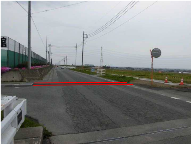
25年度 横断暗渠施工済箇所 (さわやか交流館南側付近)