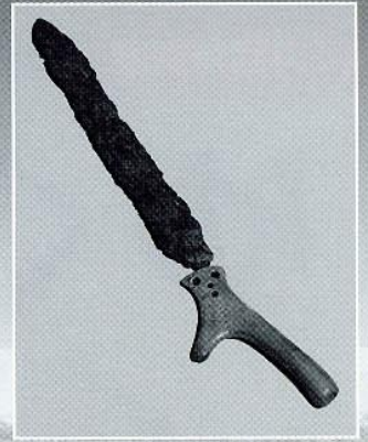
有馬遺跡出土の鉄剣と 新保田中村前遺跡出土の柄