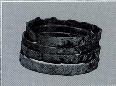
有馬遺跡出土銅釦