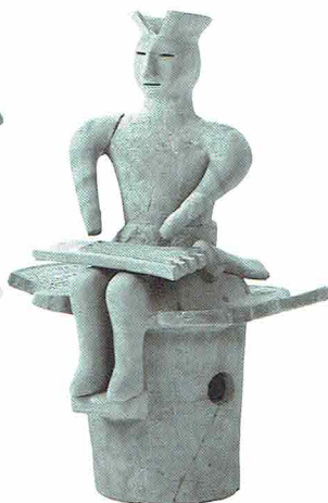
琴を弾く男性埴輪