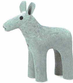
矢を受けたシカの埴輪