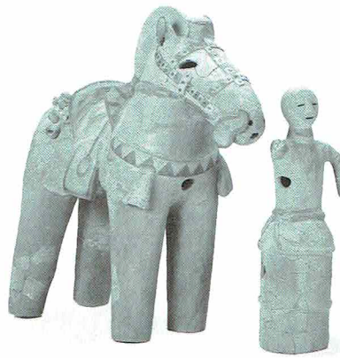
飾り馬と馬子の埴輪