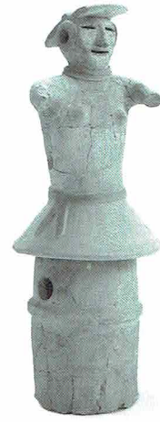
ささげ持つしぐさの女性埴輪