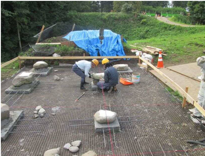
城門復元工事（礎石据付作業）