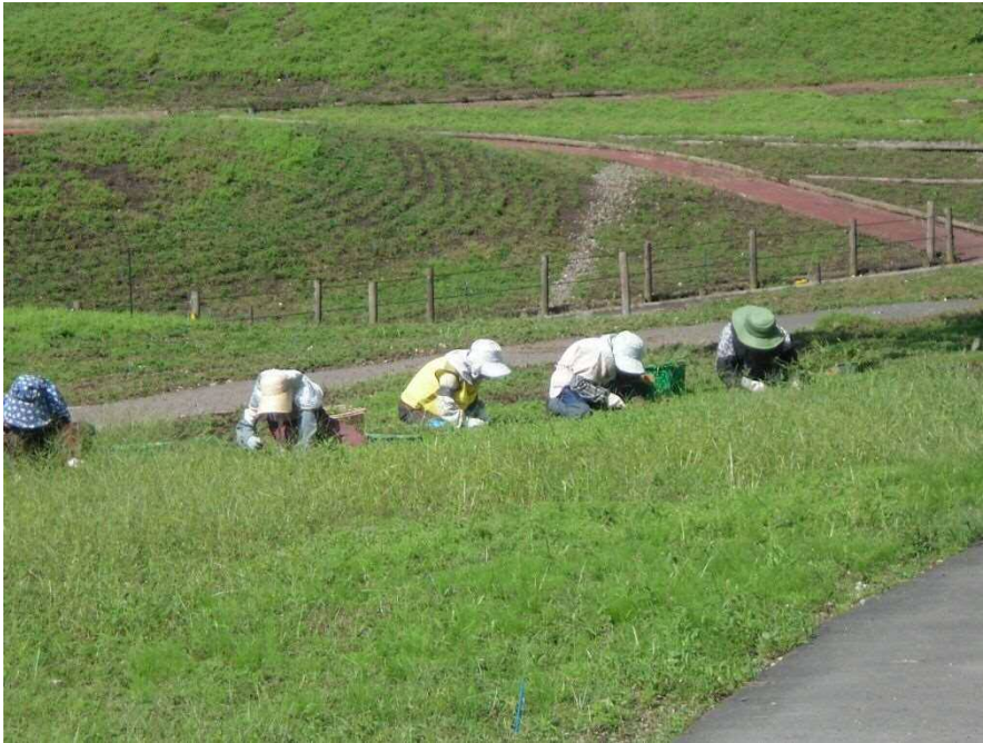
芝桜公園除草作業