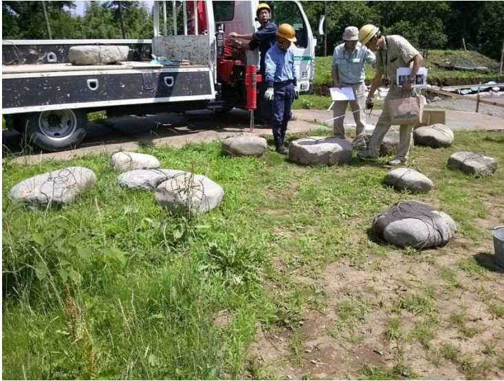
城門復元工事（礎石材料検査の様子）