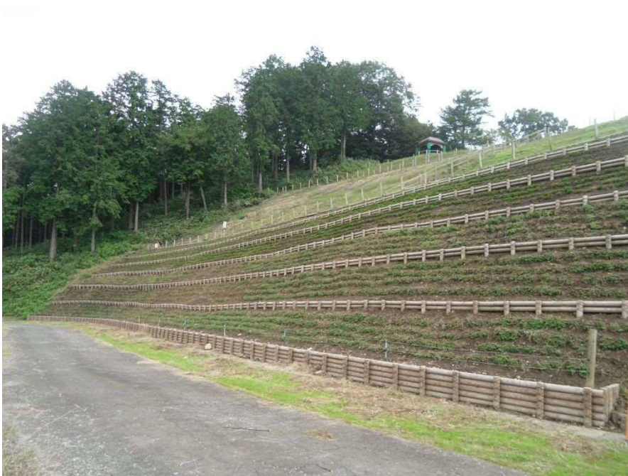
急傾斜部分土留整備