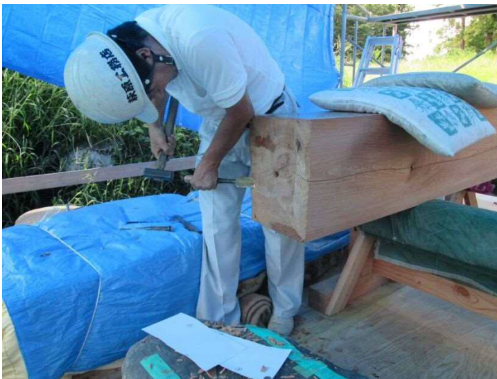
城門復元工事（柱加工状況）