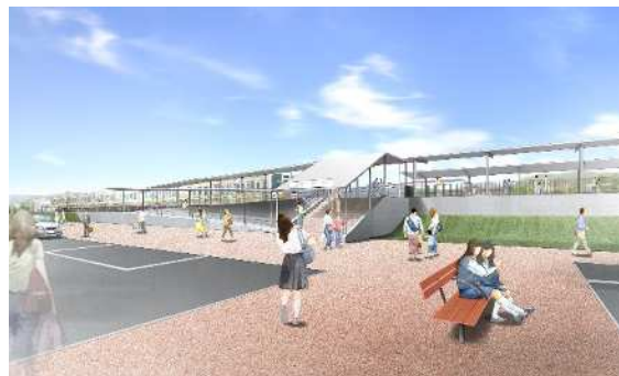
豊岡新駅（仮称）イメージ図

公共交通機関の更なる拡充を図り、地域住民の利便性向上、持続可能な公共交通ネットワークの確立を目指して、JR信越本線の豊岡地区に新駅を設置します。