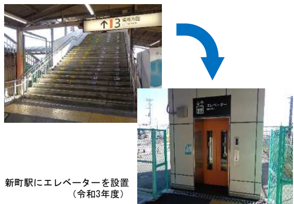
新町駅にエレベーターを設置 (令和3年度)

誰もが安心・安全に駅を利用できるようエレベーターやスロープによる段差の解消やバリアフリートイレの設置等を進めます。