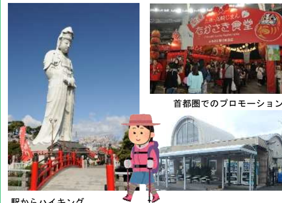
首都圏でのプロモーション

高崎市の魅力ある観光資源をJR東日本のネットワークを活用し首都圏に発信することで、観光振興を図ります。