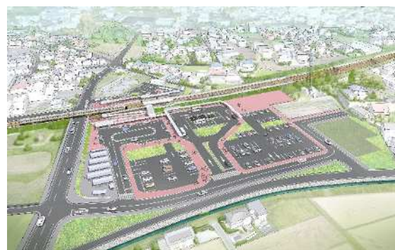
豊岡新駅（仮称）駅前広場イメージ図

自家用車やバスから鉄道への安全・快適な乗り換えを実現するため、駅前広場やパークアンドライド駐車場の整備、駅へのアクセス道路整備を行います。