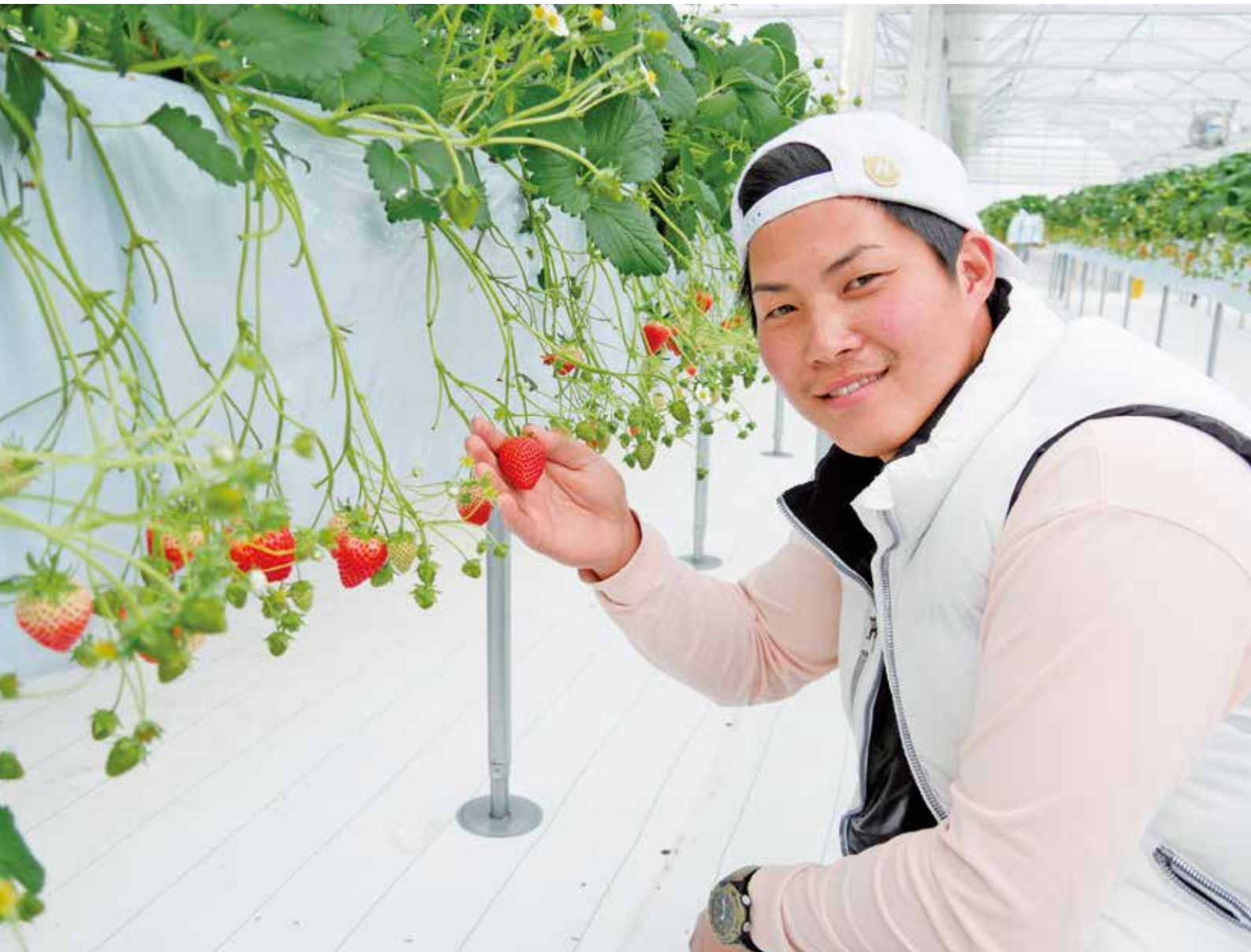
ダンクバンズファーム(上大類町)

ホームページ http://www.city.takasaki.gunma.jp E-mail nougyou@city.takasaki.gunma.jp