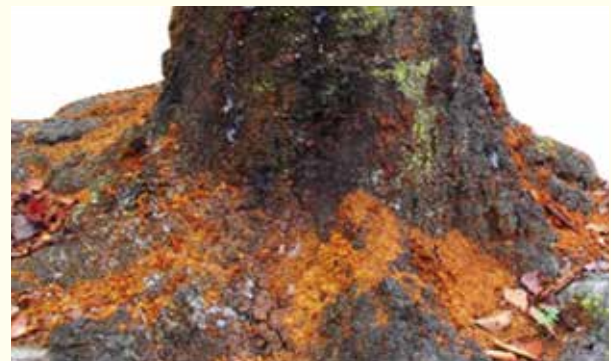
↑サクラの根元にたまったフラス