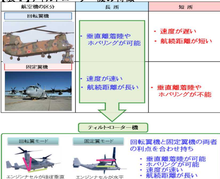
【表Ⅰ】ティルトローター機の特徴