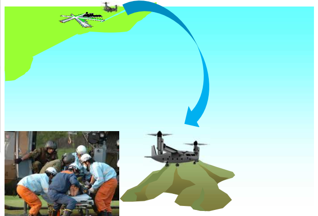
飛行場のない離島でも離着陸可能