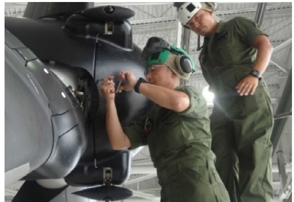
機体の点検・整備