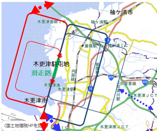
場周経路（イメージ）