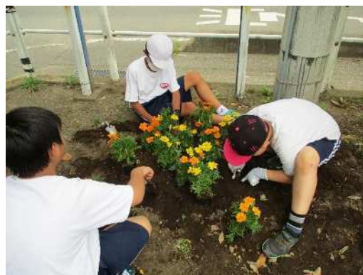
1年生と6年生が近くの公園に花を植えました。学校では、プランターに植えて花を育てています。