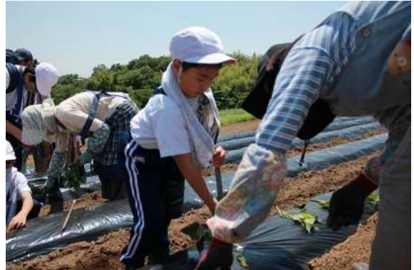
鼻高展望花の丘にヒマワリの種やサツマイモの苗を植えました。