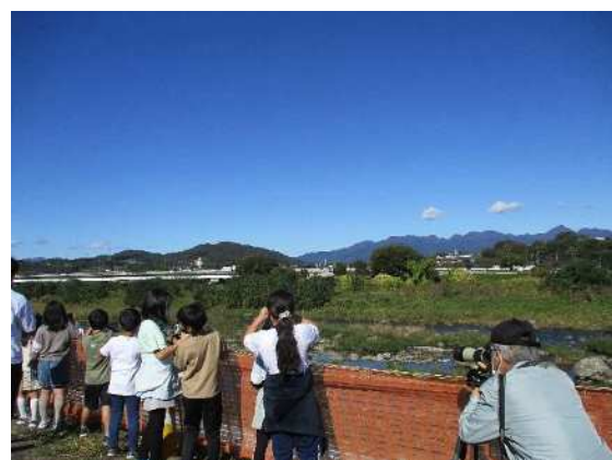
たくさんの野鳥を観察することができました。

校庭から見える野鳥を双眼鏡で観察し、野鳥について詳しく教えていただきました。野鳥が