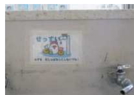
節電・節水を呼びかける掲示物