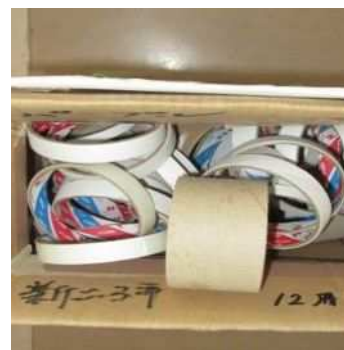
全校への呼びかけで集まった エコキャップと巻き芯