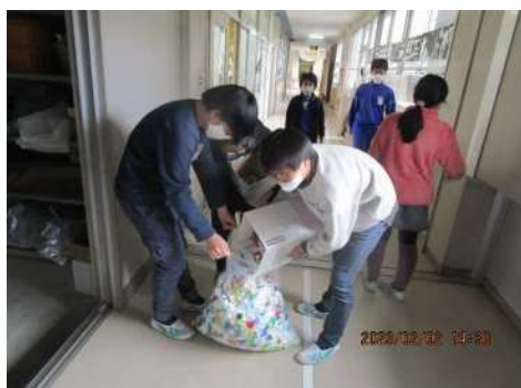
JRC委員会による エコキャップの回収の様子

JRC委員会と栽培委員会の児童が全校児童に呼び掛け、教室や家庭内で出た粘着テープの巻心を回収し、資源として再利用するエコ活動に参加しています。回収した巻心は、段ボールに再生されたり、マンダロウの植樹等の支援金として使われたりします。