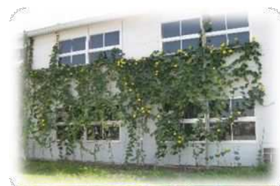
ヘチマのグリーンカーテン