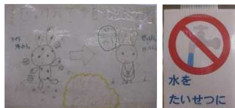
環境美化委員が作製したポスター

環境美化委員会では、ポスターを作成して校舎内に掲示し、校内美化や節水・節電などの省エネ活動などを全校に呼びかけてきた。