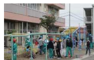
縦割り班での清掃の様子

班長が中心となり、縦割り班での清掃活動を11月に実施した。朝行事の時間に全校児童が縦割り班に分かれて、花壇の除草や校庭のゴミや石、学校周辺の落ち葉を拾い校庭の環境美化を行った。