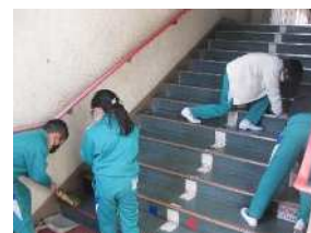
清掃週間での清掃の様子

学期末に清掃週間を設け、曜日ごとに床や棚、窓などを全校で重点的に清掃した。今年度から期間中は、環境美化委員会の5・6年生が低学年の児童と一緒に活動し、掃除の仕方を教えたり低学年の児童ではできない場所の清掃をしたりするなど清掃の手本を示して活動した。