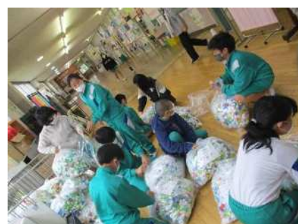
ペットボトルキャップ回収の様子

給食の牛乳パックは、洗って乾かし毎週火曜日に資源物として回収していたが、現在は休止している。