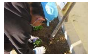
正門花壇と植え替えの様子