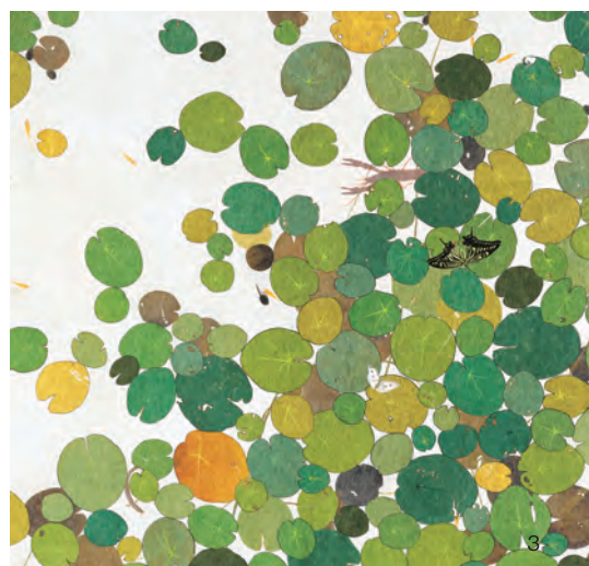
1 芽吹く生命—春—部分 2016年