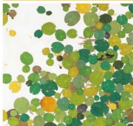
1 深遠く生命一瞬一部分 2016年 2 千年後の未来 部分 2022年 3 藤の葉と4層折 部分 2010年