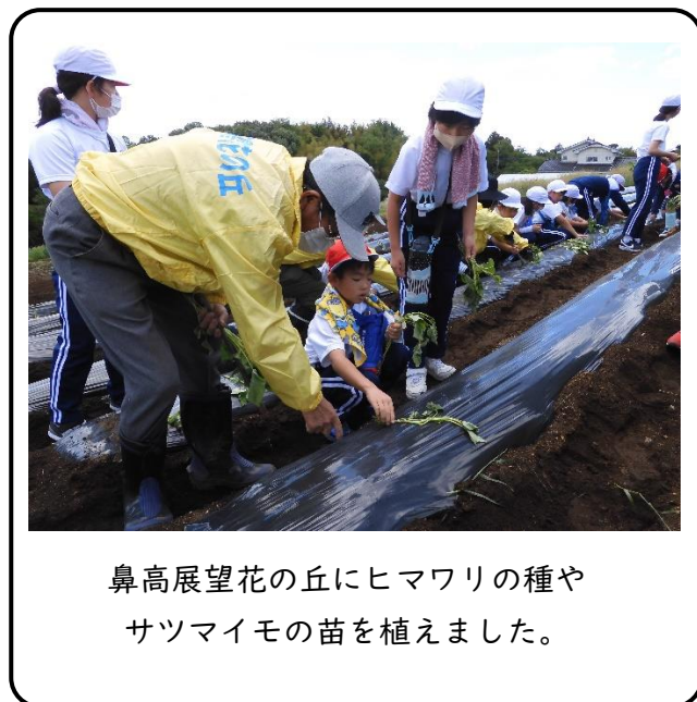
鼻高展望花の丘にヒマワリの種やサツマイモの苗を植えました。