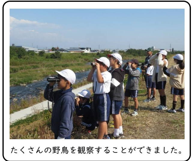
たくさんの野鳥を観察することができました。

校庭から見える野鳥を双眼鏡で観察し、野鳥 について詳しく教えていただきました。野鳥が